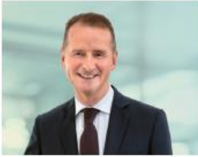
Dr.-Ing. Herbert Diess Chairman of the Board of Management of Volkswagen Aktiengesellschaft and Chairman of the Brand Board of Management of Volkswagen Passenger Cars, Volume brand group, China