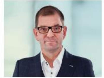
Markus Duesmann Premium