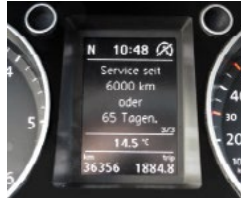
Service < 1.000 km/fällig