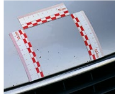
Mehr als fünf Steinschläge pro 10 \times 10 cm