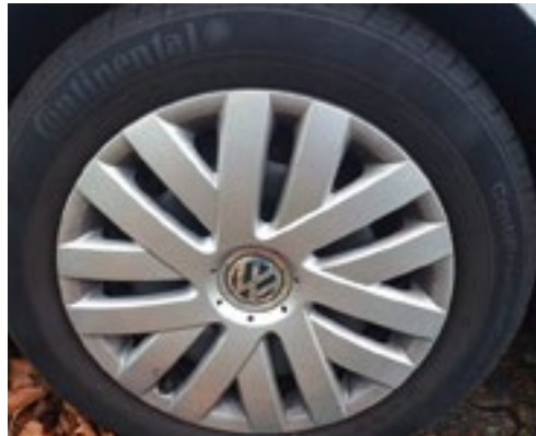
Leichte Kratzer an Radkappe