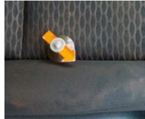
Starke Verschmutzung der Polsterung