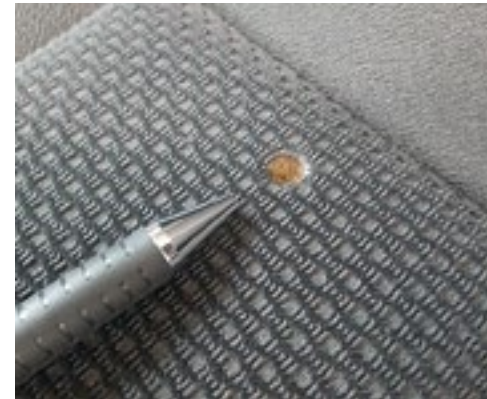
Brandloch im Sitzbezug