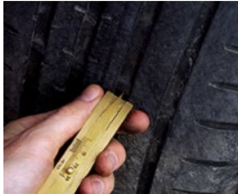
Sommerreifen > 4 mm