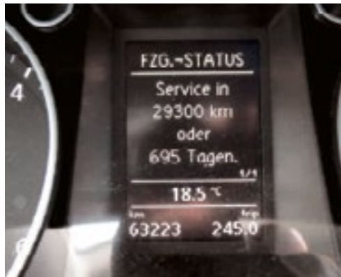
Service > 1.000 km