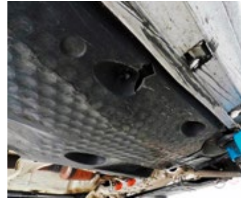
Beschädigung der Unterbodenverkleidung