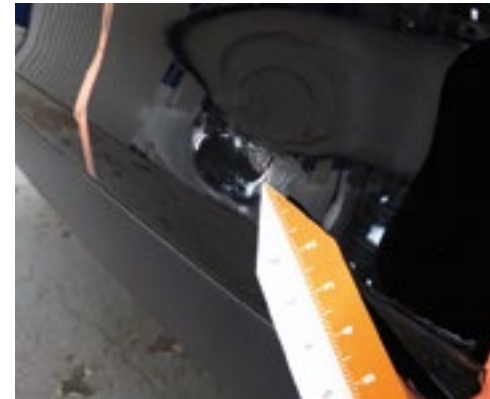
Beschädigungen und Brüche