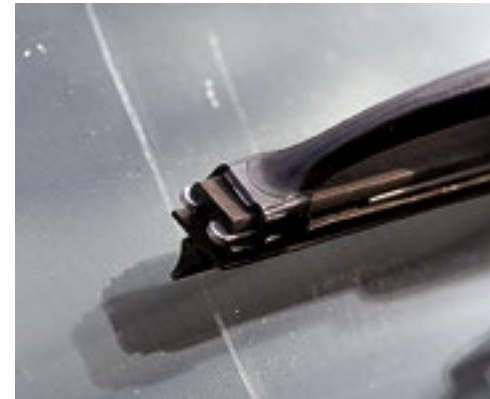
Kratzer > 10 mm