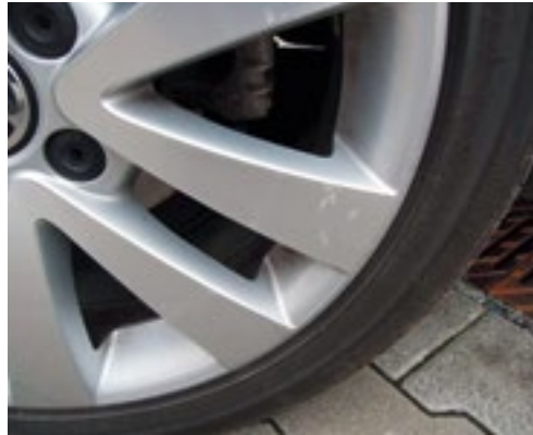
Leichte Kratzer ohne Materialabtragung