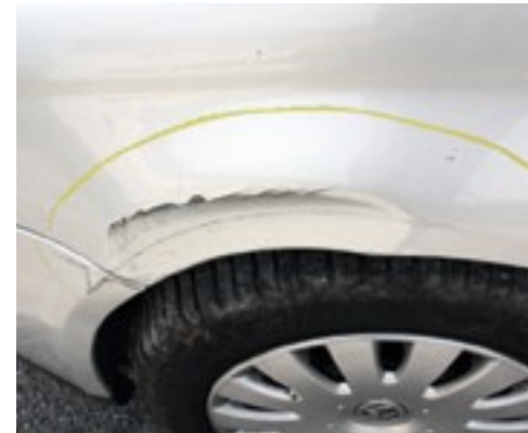
Deformation > 20 mm