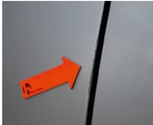
Leichter Lackschaden an Türkante