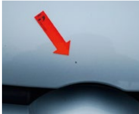
Steinschlag \leq 2 mm