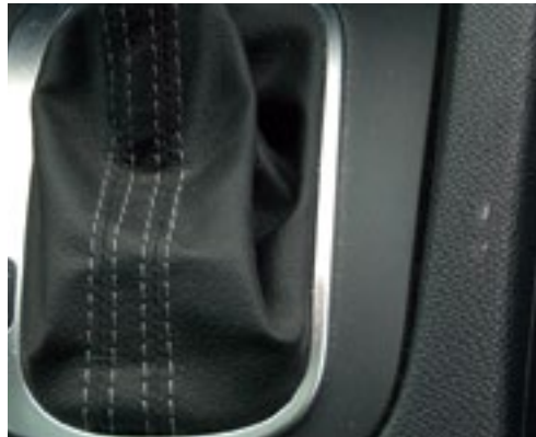
Geringfügige Beschädigung der Kunststoffverkleidung