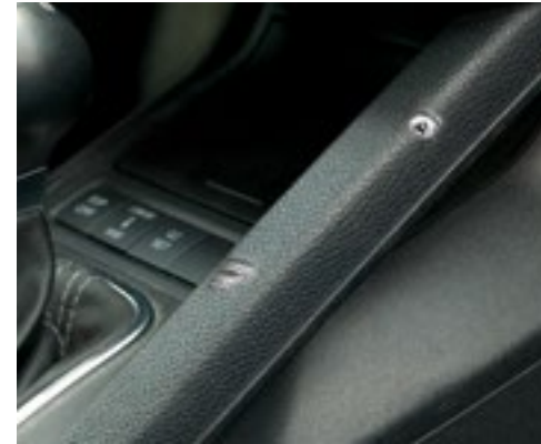
Bohrlöcher im Verkleidungsteil