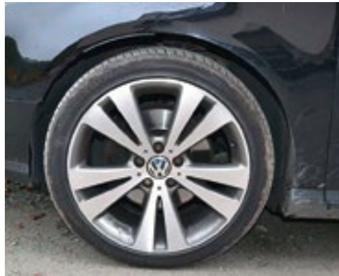
Bremsscheibe in Ordnung