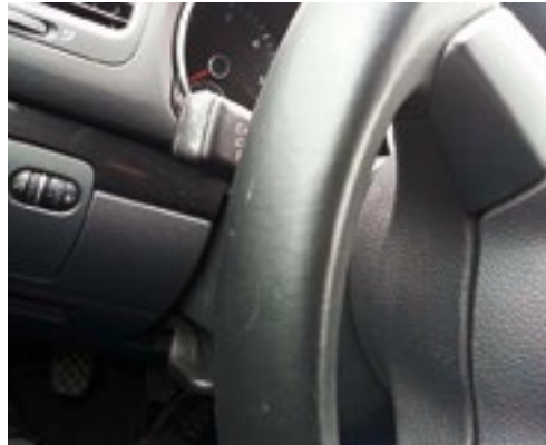
Leichte Kratzer am Lenkrad