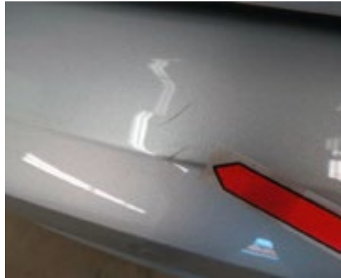
Kratzer in der Lackoberfläche