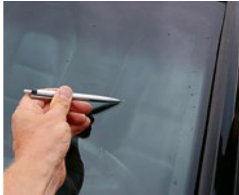
Steinschlag < 2 mm