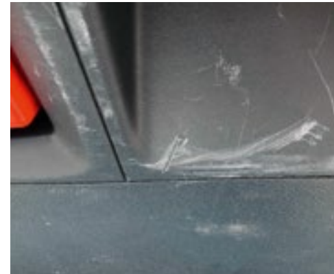
Starke Kratzer und Abschürfungen