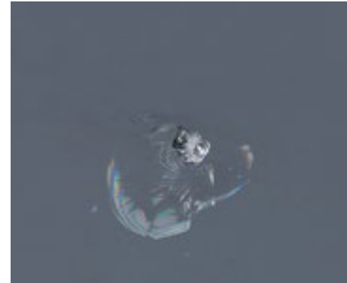
Steinschlag > 2 mm