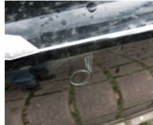
Lackschäden am Stoßfänger