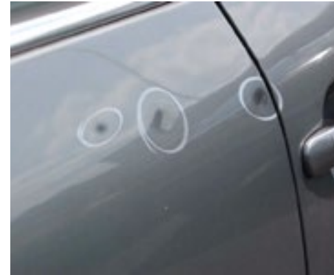
Drei Dellen an einem Karosserieteil