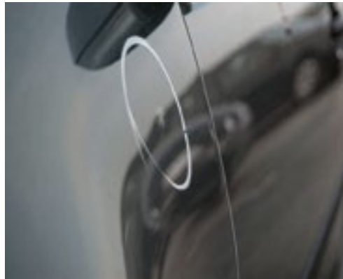
Delle < 20 mm