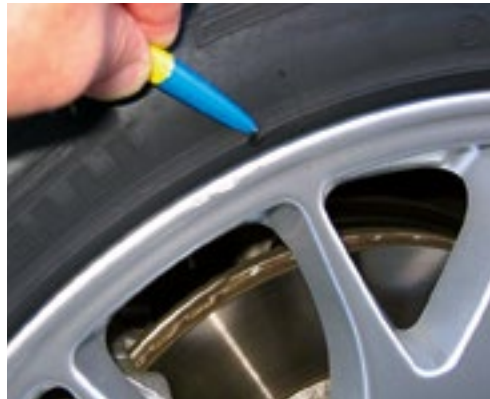
Leichte Materialabtragung an der Scheuerleiste