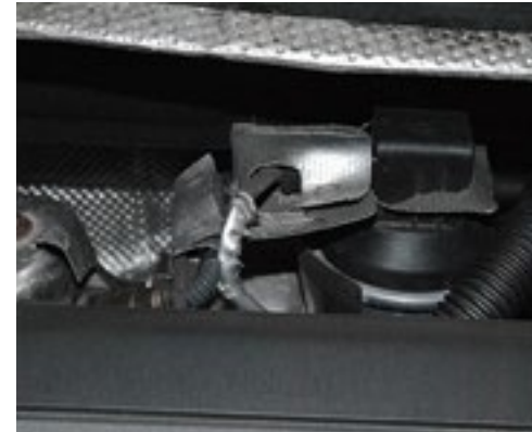
Beschädigung durch Nagetiere