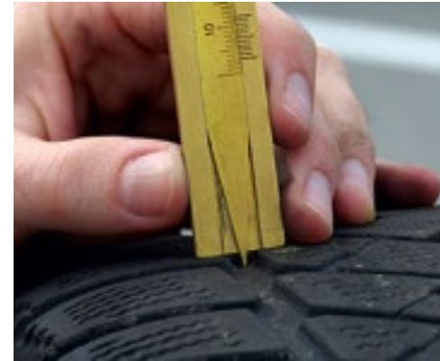
Winterreifen < 4 mm